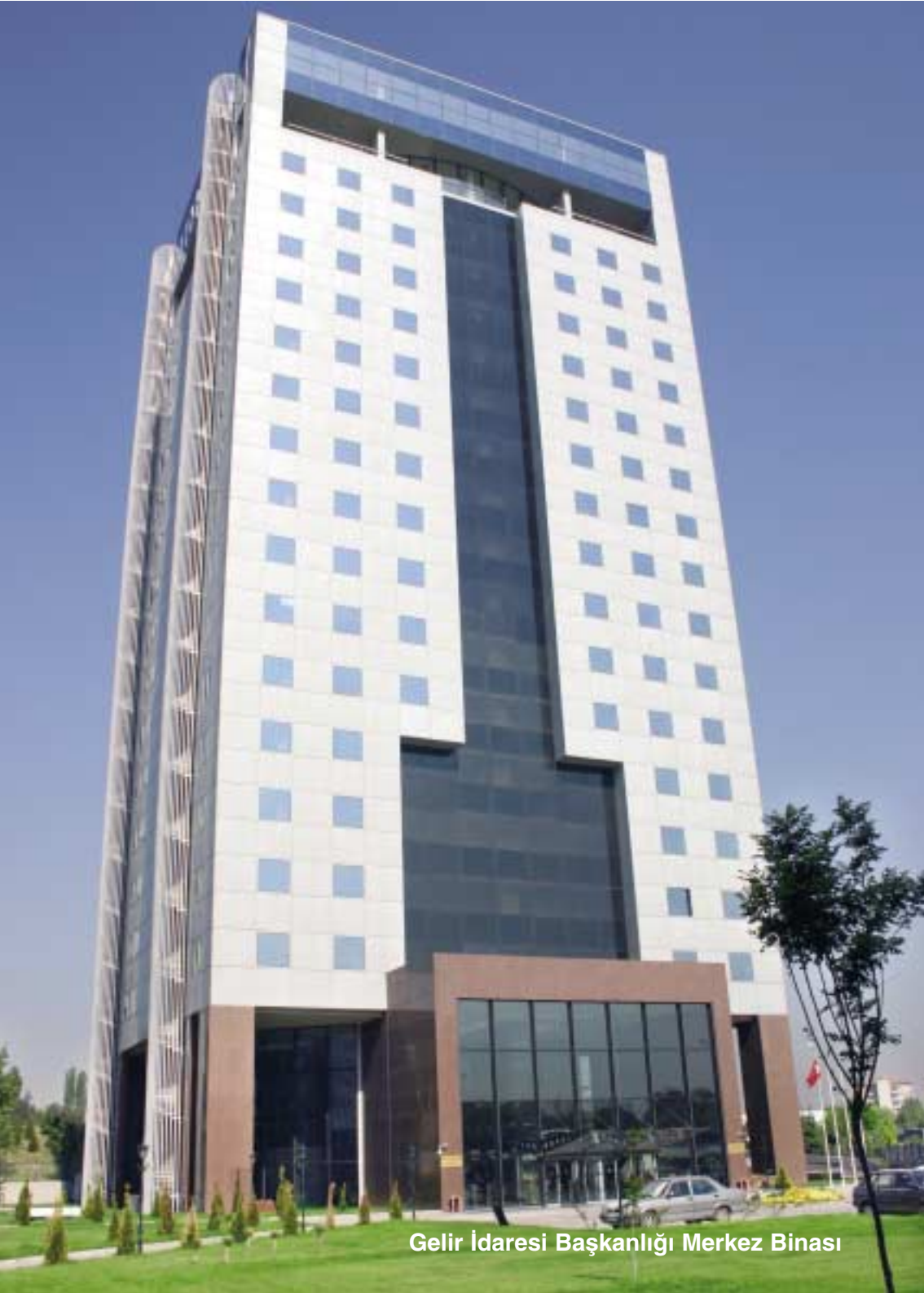
Gelir İdaresi Başkanlığı Merkez Binası